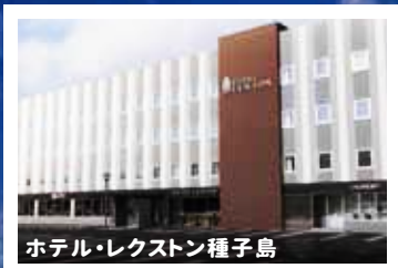
ホテル・レクストン種子島